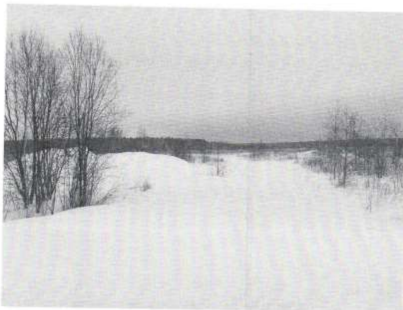
Земельный участок 50:01:0010309:751 МО Талдомский район д. Кошелево.

Фототаблица к Акту осмотра земельного участка от 14.03.2018 года с кадастровым номером 50:01:0010309:751